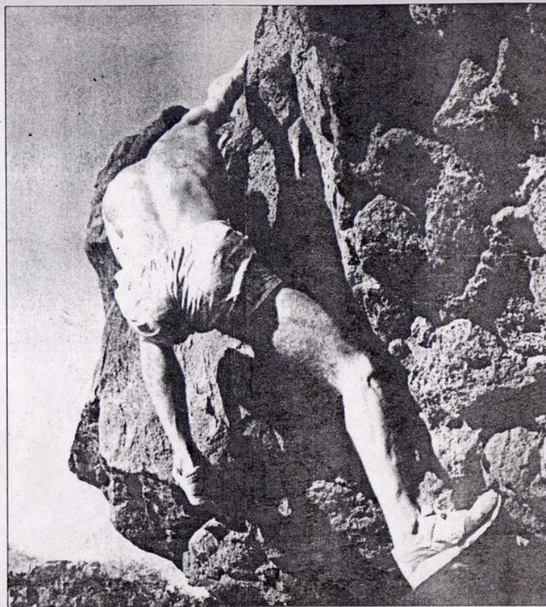
L'homme araignée en pleine action..